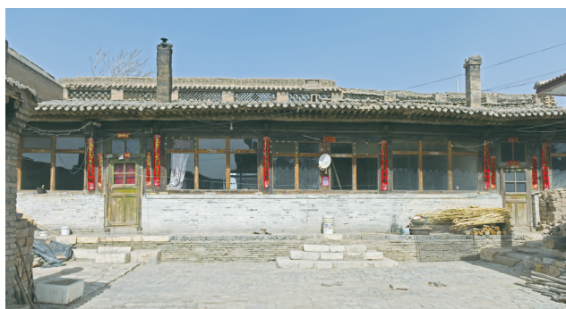
▲ 神溪村戏台 ▲ 神溪村现存的明清 古民居院落