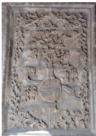
◀ 神溪村明清 古民居的精美 砖雕