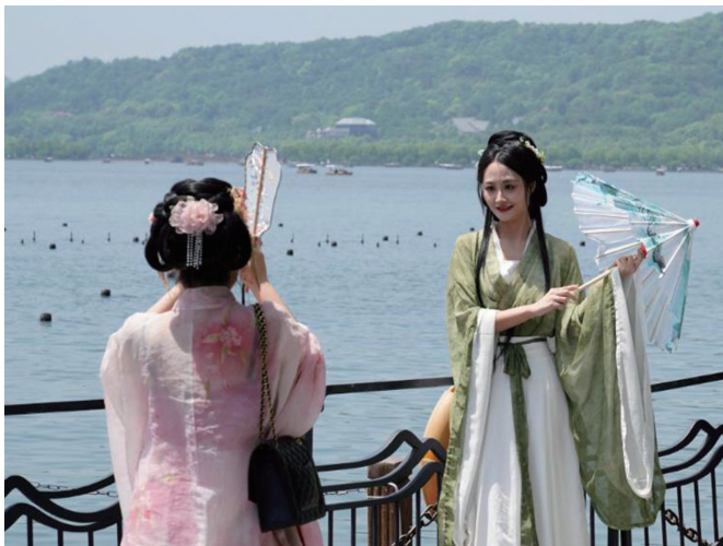
▲ 4月18日，身着汉服的游客在杭州西湖边拍照。 (资料图)

宋锦马甲搭配牛仔裤，衬衫配上马面裙，立领、云肩等元素“走”进日常着装……这个春夏，“新中式”服装持续走俏，成为国内消费市场的新现象。是什么造就了国风服饰的“流量密码”？“国潮”如何变热潮？记者走进一线市场、采访产业各方。