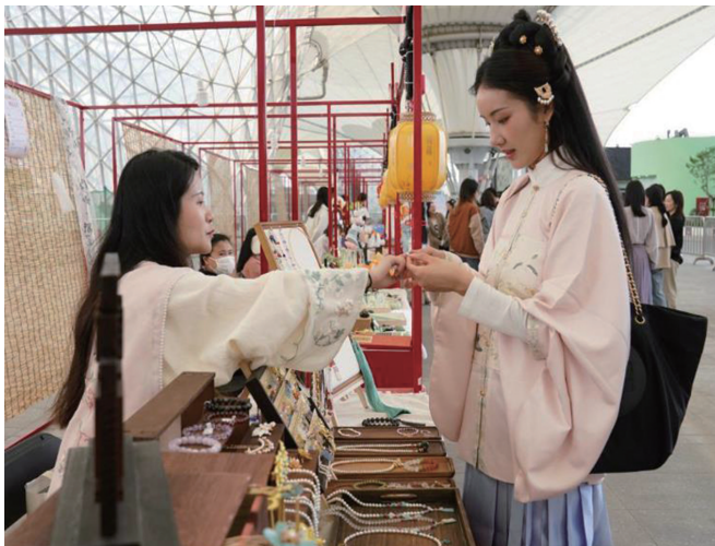
▲ 4月11日，汉服爱好者在上海“世博源”的国风市集上挑选饰品。(资料图)