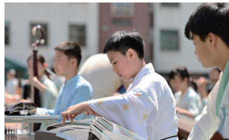
▲ 2023年5月22日，天津市南开区中心小学学生身着汉服进行古筝演奏。(资料图)