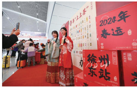
▲ 1月26日，旅客在徐州东站候车大厅身着汉服拍照。(资料图)