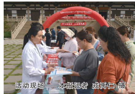
活动现场

本报讯(记者 高燕) 今年5月12日至18日是全民营养周,5月20日是中国学生营养日。16日,市卫健委在明堂公园举行2024年全民营养周暨“5·20”中国学生营养日主题宣传活动。