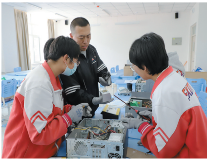
大同二中学生学习电脑组装与维修