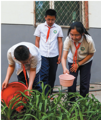
平城区49校学生为农作物浇水

劳动课具体上啥？很多家长还不清楚。平城区23校的一位学生家长说，他孩子主要是学习整理书桌、叠被子、洗碗等，倒是“解锁”了很多新技能。