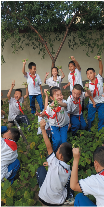
大同二十二中学生开心地收获豆角

劳动课进入中小学生的课表已有一年半，我市各学校劳动教育开展得如何？老师、学生、家长有怎样的认识和体会？记者就此进行了深入采访。