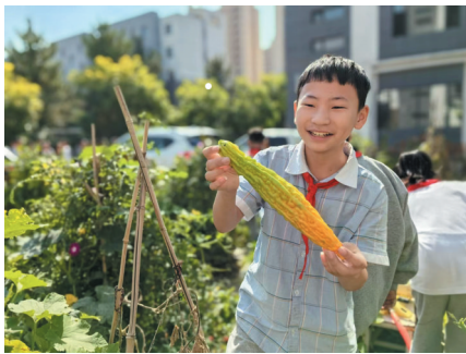
平城区文慧小学学生体验收获的快乐