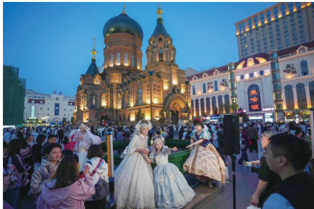
▲ 5月1日,游客在哈尔滨建筑艺术广场盛装拍照。(资料图)