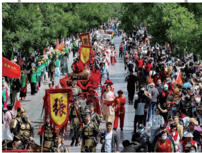
▲ 4月30日,游客在河南商丘古城观赏华服霓裳文化节巡游表演(无人机照片)。(资料图)