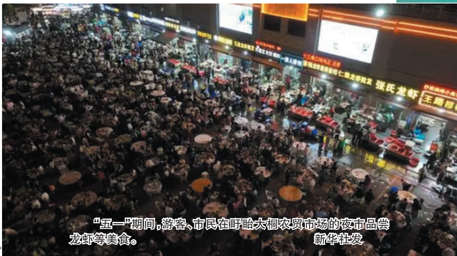
“五一”期间，游客、市民在盱眙大桐农贸市场的夜市品尝龙虾等美食。

县域旅游走红背后，有天时、地利、人和多重因素；更值得思考的是，“火起来”的县城，该如何“火下去”？