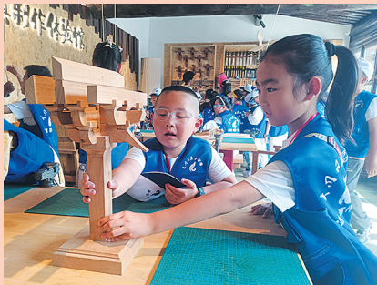
小记者们尝试动手拼装