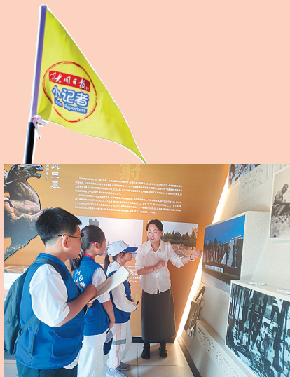
讲解员向小记者介绍灵丘的历史文化景点

通过非遗展示、精美文创、独特体验等方式，小记者们对灵丘地方文化有了不一样的认识，收获颇丰。