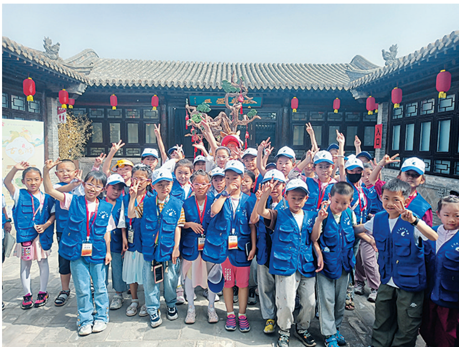
小记者们在灵丘院合影留念