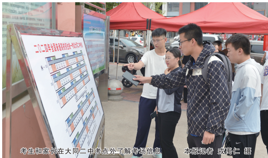
考生和家在大同二中考点外了解考场信息

记者在大同五中考点看到，考生仔细查看考场位置、核对编号，有的考生还拿出手机，把学校张贴的考场分布图拍下来，以备随时查看。