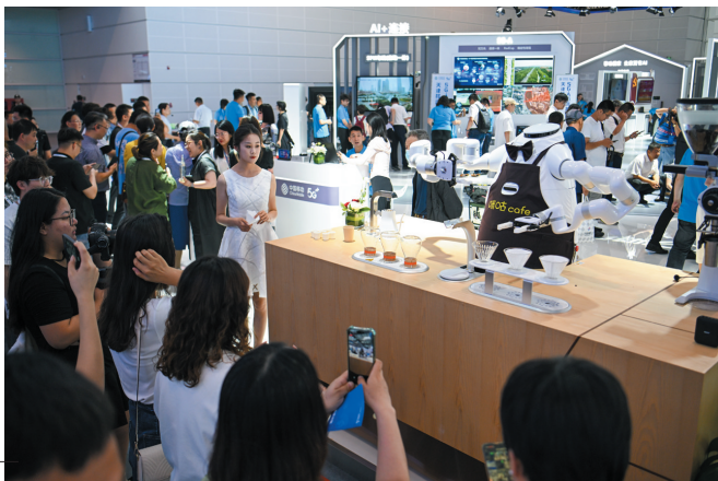
►6月21日，与会者在博览会现场观看一款咖啡机器人冲泡咖啡。

形态可掬的冲咖啡机器人、大型的全伺服自动冲压生产线、盖高楼犹如“搭积木”的造楼机……正在天津举行的2024世界智能产业博览会上，以“智”促“新”的场景扑面而来，数智技术正成为传统产业锻造新质生产力的引擎。