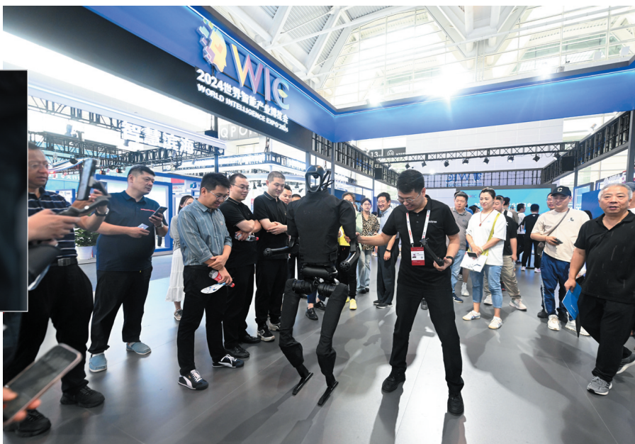
▲6月21日，工作人员在博览会上和一款仿生机器人互动。