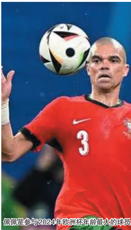
佩佩是参与2024年欧洲杯年龄最大的球员