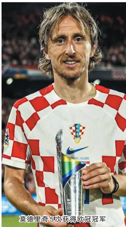
莫德里奇5次获得欧冠冠军