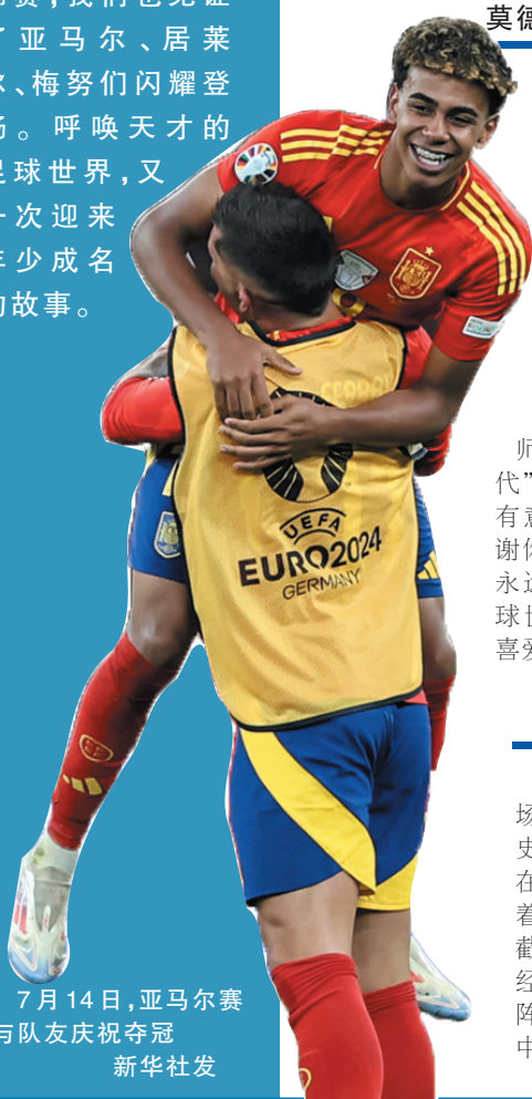
7月14日，亚马尔赛后与队友庆祝夺冠