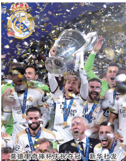
莫德里奇捧杯庆祝夺冠

莫德里奇2012年加盟皇马，目前已成为球队出场534次，打入39球。迄今为止，他共随皇马获得26个冠军，包括6个欧冠、5个世俱杯、4个欧洲超级杯、4个西甲冠军、2个国王杯、5个西班牙超级杯。