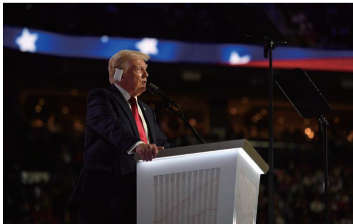
◀ 7月18日,美国前总统特朗普在密尔沃基的共和党全国代表大会上发表演讲。

6月底,美国2024年总统选举迎来首场候选人电视辩论。这本应是一场关于执政理念的讨论,却沦为两位候选人之间没有底线的人身攻击。美国有线电视新