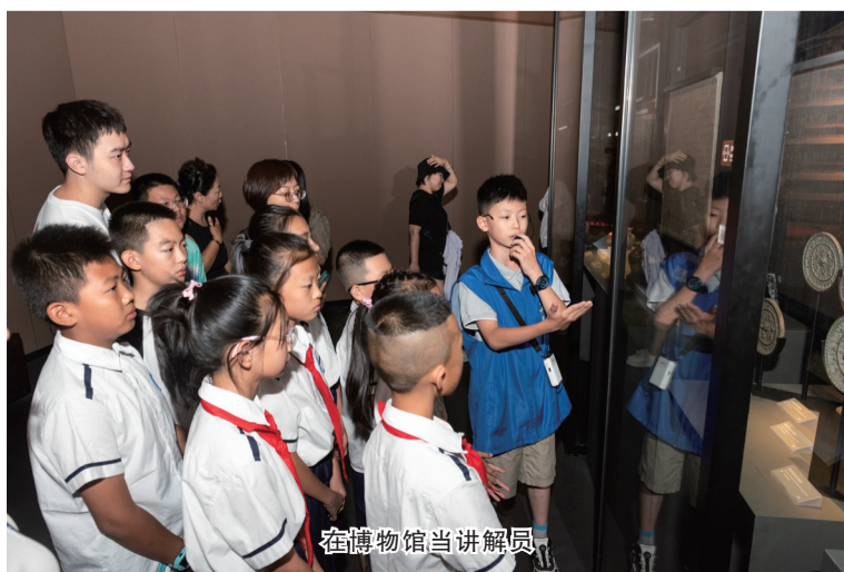
在博物馆当讲解员