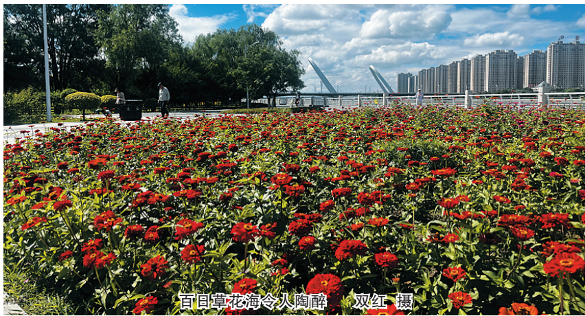
百日草花海令人陶醉

据园林工作人员介绍，百日草也叫百日菊，为一年生草本植物，是著名的观赏花卉。因其耐旱性，非常适合北方地区的园林绿化，在我市园林中常用作花卉景观配置。之所以被称为百日草，是