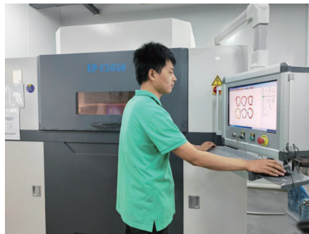
▲西安康拓医疗技术有限公司工程师查看3D打印设备工作情况。(资料图) 新华社发