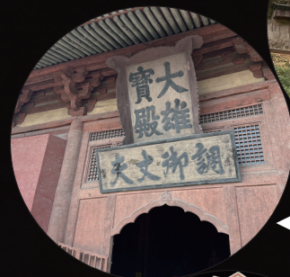
华严寺大雄宝殿匾额