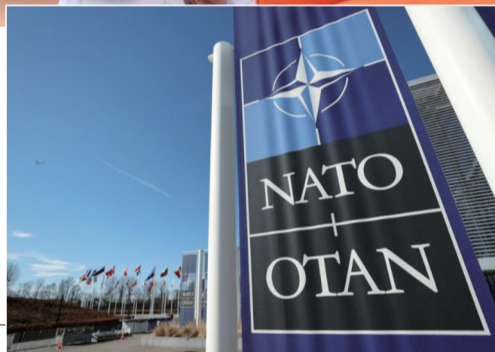
▶ 这是3月14日在比利时布鲁塞尔拍摄的北约总部一角。(资料图)

针对美国和英国近来考虑允许乌克兰使用外援武器远程打击俄罗斯本土纵深目标，俄罗斯总统弗拉基米尔·普京12日警告，这是“偷换概念”，问题本质并非是否解禁，而是北大西洋公约组织国家“是否直接参与”俄乌冲突。