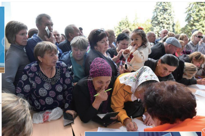
▲ 8月14日，在俄罗斯库尔斯克市，来自俄乌边境地区的居民领取物资。(资料图)