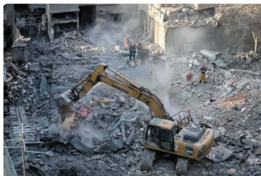
▲10月11日,在黎巴嫩首都贝鲁特,人们在以色列袭击现场清理废墟。