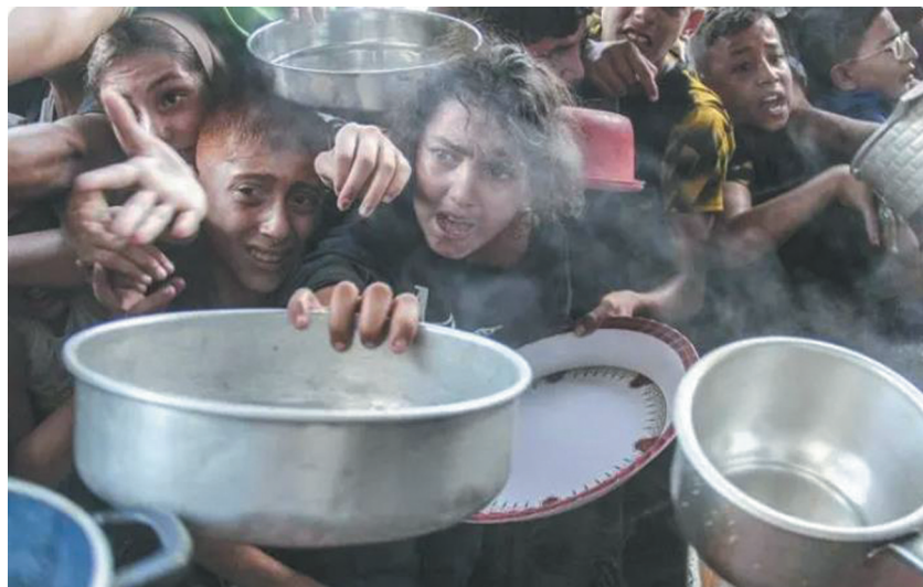
▲9月12日,加沙城,包括儿童在内的巴勒斯坦人等候发放食物。

以色列11日迎来犹太教重要节日“赎罪日”。国际社会持续谴责以色列违反国际法、袭击联合国驻黎巴嫩临时部队(联黎部队),敦促以方立即停止袭击担负维和使命的该部队。中美洲国家尼加拉瓜为声援巴勒斯坦,宣布与以色列断交。