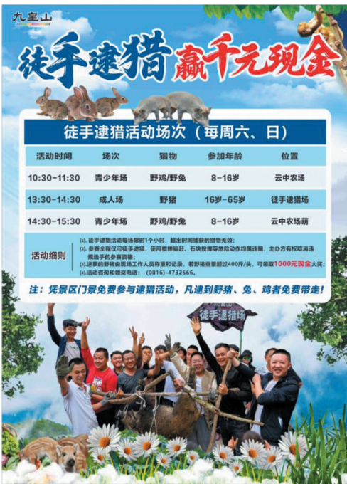
▲九皇山公众号宣传图。