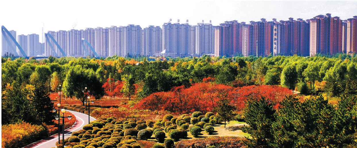
御河生态园色彩斑斓