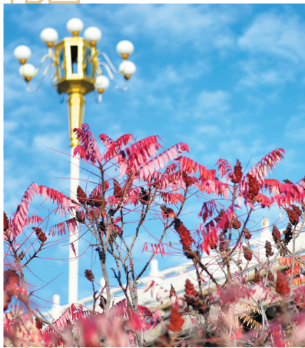
蓝天下的火炬树绚丽多姿