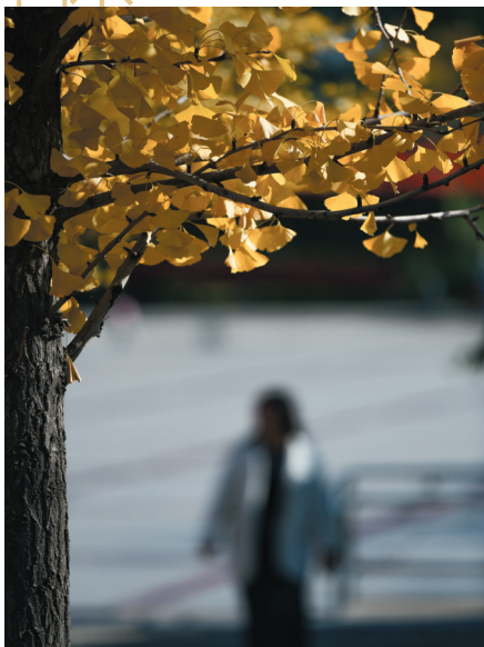
银杏叶片片金黄告秋来