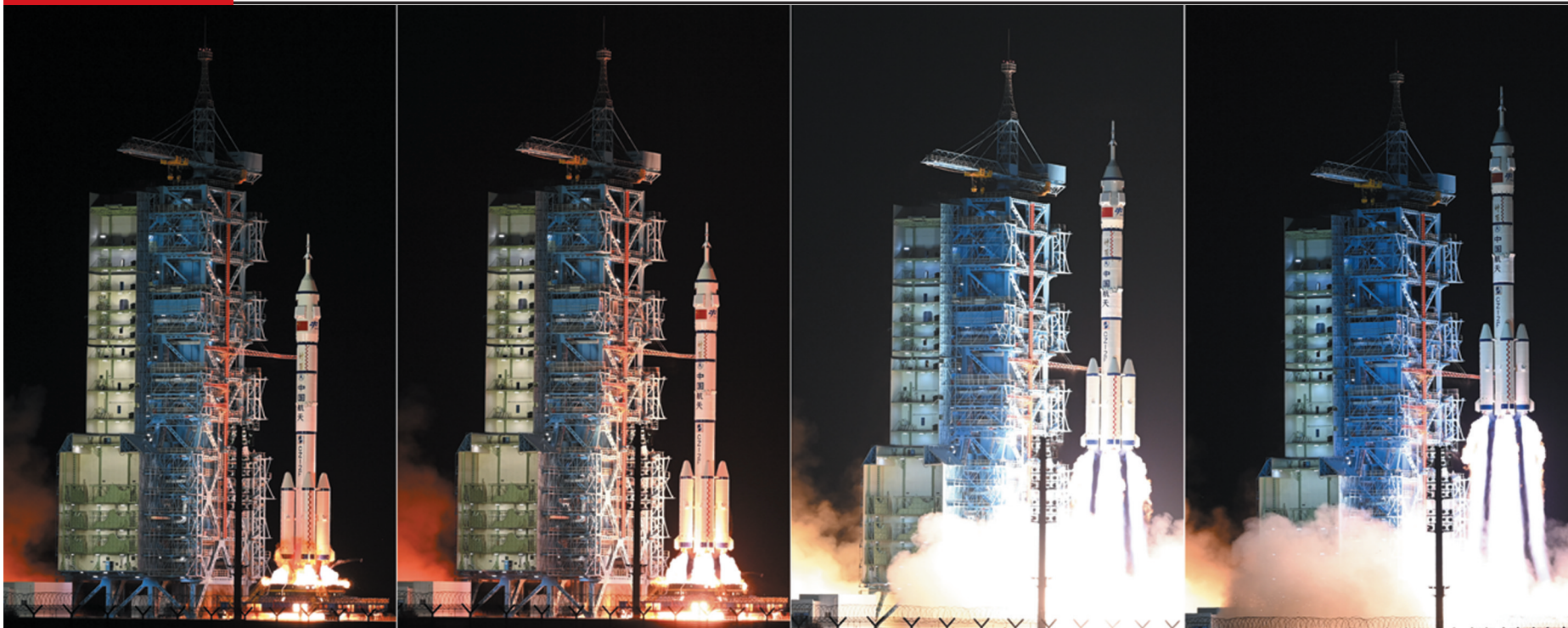
▲10月30日,搭载神舟十九号载人飞船的长征二号F遥十九运载火箭在酒泉卫星发射中心点火发射。新华社发