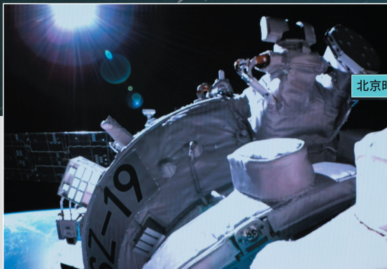
北京时间 2024年10月30日11时00分

◀10月30日在北京航天飞行控制中心拍摄的神舟十九号载人飞船和空间站天和核心舱前向端口对接过程的画面。