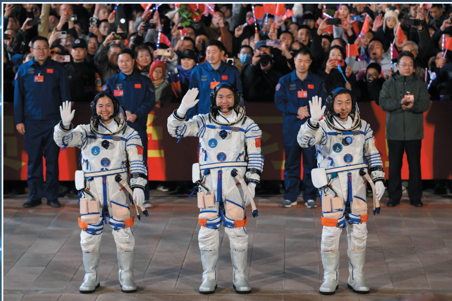
▲10月30日,神舟十九号载人飞行任务航天员乘组出征仪式在酒泉卫星发射中心问天阁圆梦园广场举行。这是航天员蔡旭哲(右)、宋令东(中)、王浩泽在出征仪式上。

这次任务是我国载人航天工程进入空间站应用与发展阶段的第4次载人飞行任务,是工程立项实施以来的第33次发射任务,也是长征系列运载火箭的第543次飞行。