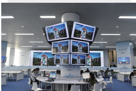
▲这是11月4日拍摄的第七届进博会新闻中心。

能打开观众和市场对于玻璃的无限想象。——升级打造创新孵化专区，首次聚焦数字经济、绿色低碳、生命科学、制造技术四大赛道进行策展。