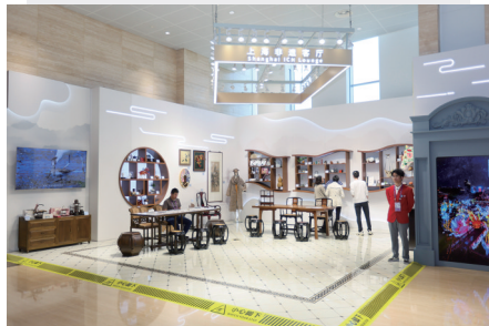
▲11月3日拍摄的第七届进博会新闻中心内的上海非遗客厅。