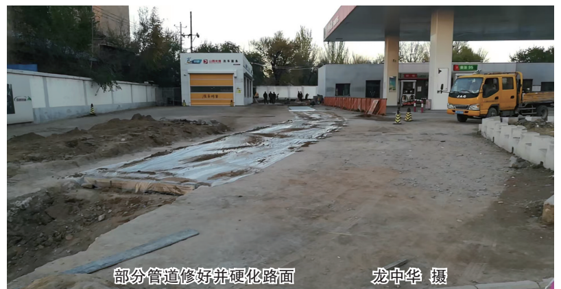
部分管道修好并硬化路面

就此，桥西社区负责人告诉记者，针对该小区还有一口污水井不畅通的问题，他们正在积极协调，让小区的污水管道彻底通畅。