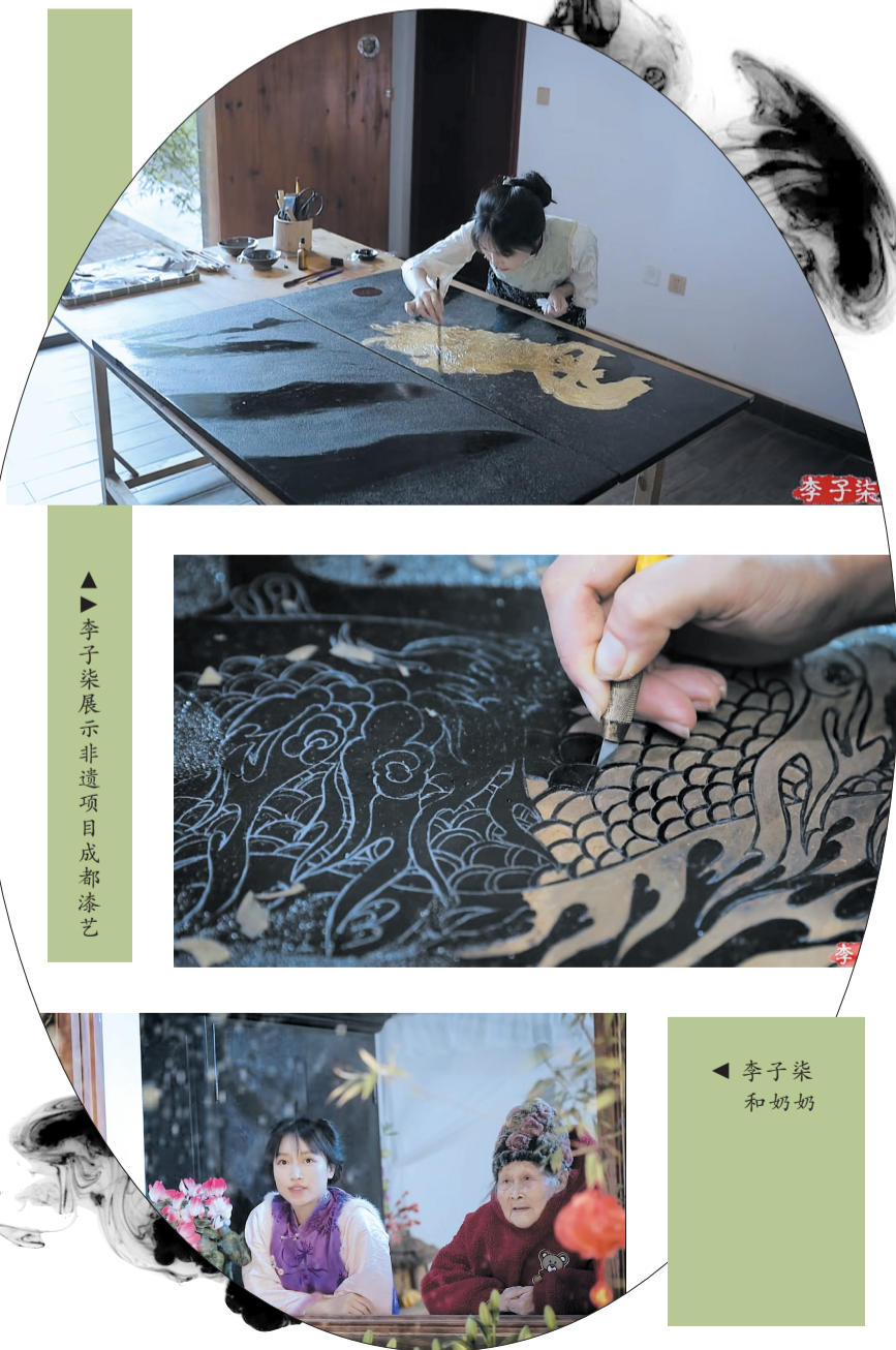
▲ 李子柒展示非遗项目成都漆艺

今年4月至9月，李子柒进行了复出前的最后准备。子柒文化如今拥有多个“李子柒”与“子柒”商标，品类包括方便食品、啤酒饮料、服装鞋帽等。未来李子柒仍可在自有品牌上大展拳脚，而这一次，再没有MCN机构与她争夺主控权。