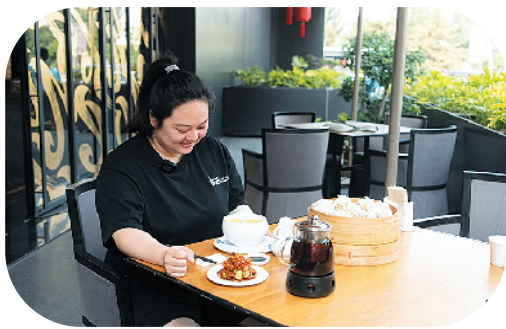
优雅的就餐环境中 烧麦套餐组合上桌