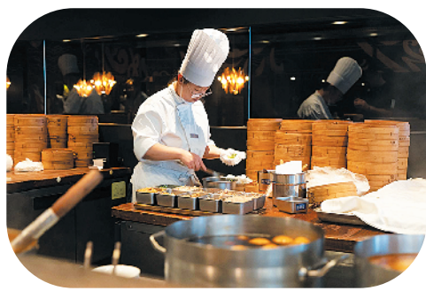
干净的明档厨房里 烧麦现包、现蒸、现卖

大同烧麦,不仅好看好吃,而且有历史有故事;大同烧麦,形如石榴,洁白晶莹,馅多皮薄,美味可口,是大同饮食文化中最雅致的美食符号之一。