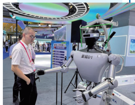
▲ 图为“里掂人形机器人”和观众交流互动。(资料图)