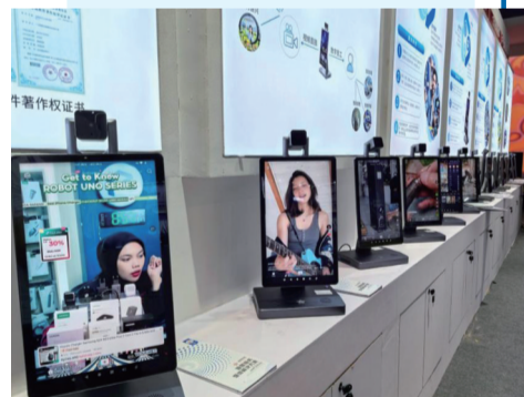
▲ 广东智慧音视频科技有限公司展出的多功能直播智慧机。(资料图)