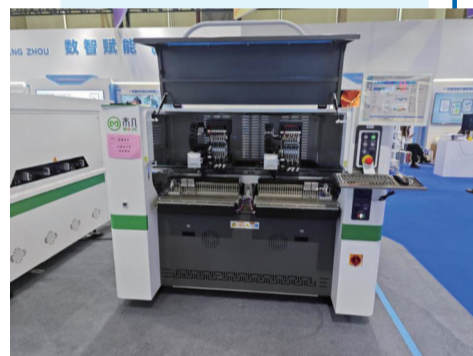
▲ 广东木几智能装备有限公司展出的多功能贴片机。(资料图) 新华社发