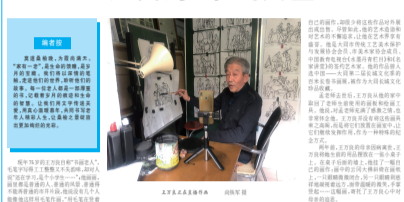
王万良书画作品集