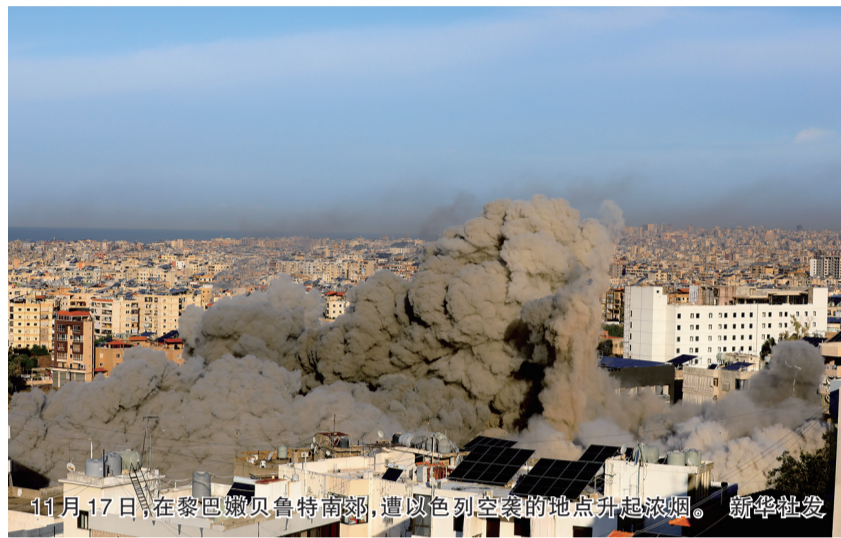
11月17日，在黎巴嫩贝鲁特南部，遭以色列空袭的地点升起浓烟。

伊朗最高领袖哈梅内伊的顾问阿里·拉里贾尼15日访问黎巴嫩。被问及美方所提停火草案时，拉里贾尼表示，伊