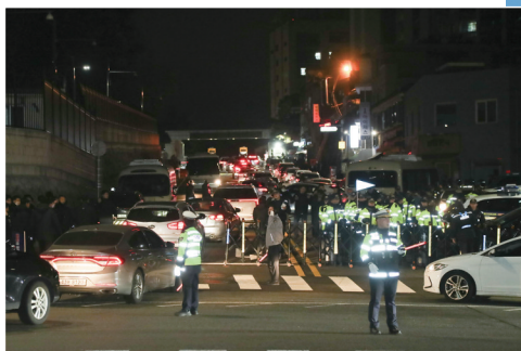
▲ 12月4日凌晨,警察在韩国首尔的韩国总统府外戒备。