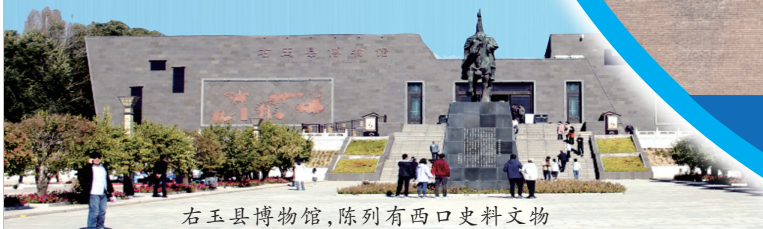
右玉县博物馆，陈列有西口史料文物

出大同向西行80千米来到右玉县，这里历史悠久、文化厚重，境内长城逶迤，军堡林立、古寺神奇、山川秀美。众多人文古迹中，名气最大也最为人津津乐道的莫过于西口。历史记忆里，西口不只是地理通道，还与王朝更迭、民族融合、经济发展、人口迁徙密切相关。若想深入探究西口文化，需要实地行走探访。