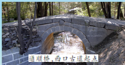
顺顺桥，西口古道起点

正因地理位置重要，中原王朝控守北边十分留意此处，赵国设雁门郡置善无城，秦汉时期为雁门郡郡治，东汉设阴馆县，唐天宝年间设静边城，驻有静边军。明在原善无城的基础上建起卫城，将右卫、玉林卫合治，为后代留下“右玉”之名。