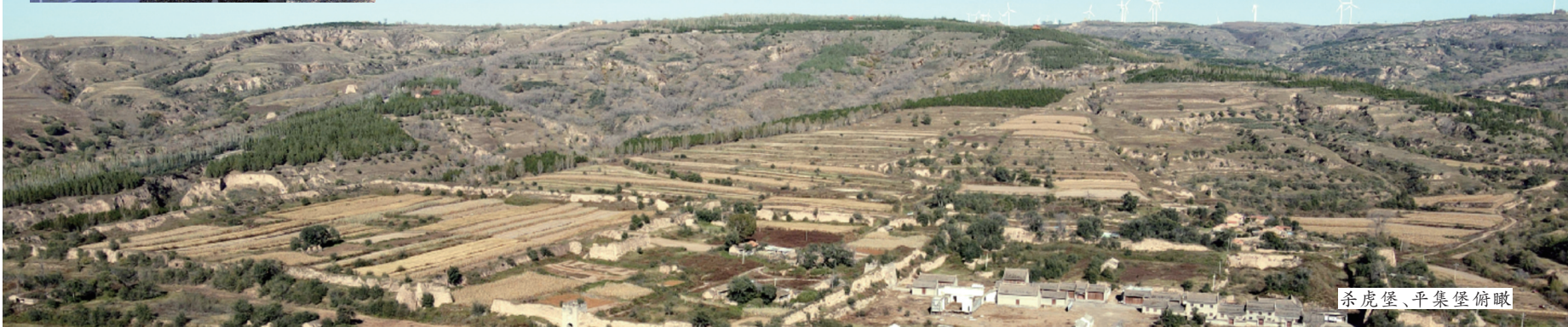
杀虎堡、平集堡俯瞰