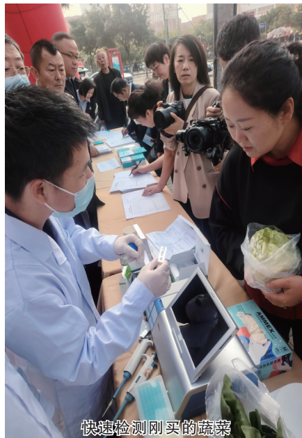
快速检测刚买的蔬菜

次，市场监管部门对不合格品种生产经营单位依法依规进行了处理，并通报相关部门加大对相关产品的监管力度，有效保障了公众“舌尖上的安全”。