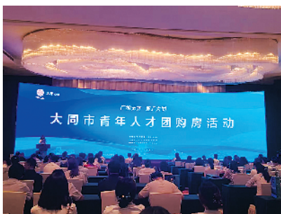
大同青年人才团购活动