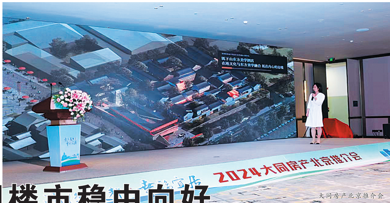
大同房产北京推介会

随着2024年的脚步渐行渐远,今年的楼市也即将画上句号。回望这一年,我市房地产市场发生了很多变化。这一年,我市房源供应充足,市场竞争日趋激烈,促销去库存是各大房企的主旋律。好在伴随着一系列房地产金融举措和调整优化政策的利好,大同房地产市场焕发出新的活力,也迎来了新的发展契机。