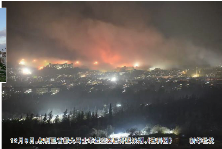
12月25日，叙利亚首都大马士革上空升起浓烟。(资料图)