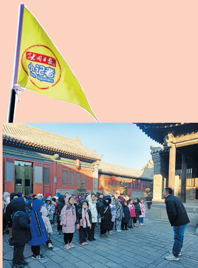
小记者编辑部老师强调活动注意事项

“京华·锁钥”“法相·庄严”“茗酌·商贸”“溢彩·生活”四大展厅,全方位、多角度勾勒出辽金元时期西京大同的盛景,通过参观,小记者们充分了解了当时大同的历史地位、经济发展和文化成就,从而感知到大同厚重的民族融合文化。