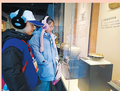
小记者参观馆内展品