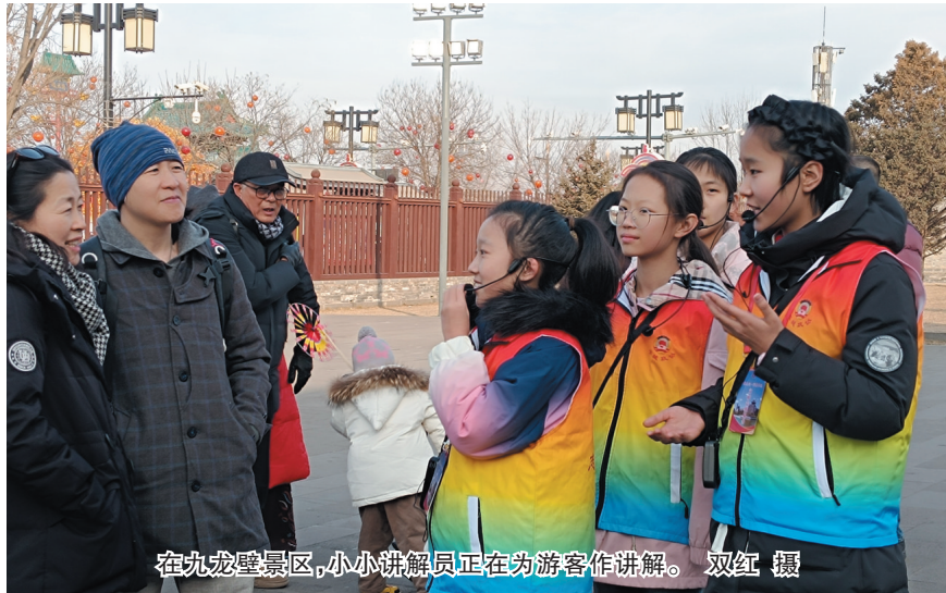
在九龙壁景区，小小讲解员正在为游客作讲解。

外治愈。游客纷纷上前与她拍照留念，还不住夸赞她讲解得有模有样。小小讲解员的家长们也十分给力，陪伴在旁，为孩子们加油鼓劲儿。他们的默默付出，让游客真切感受到大同的热情好客和淳朴的民风，也为古城旅游增添了一抹温暖的亮色。