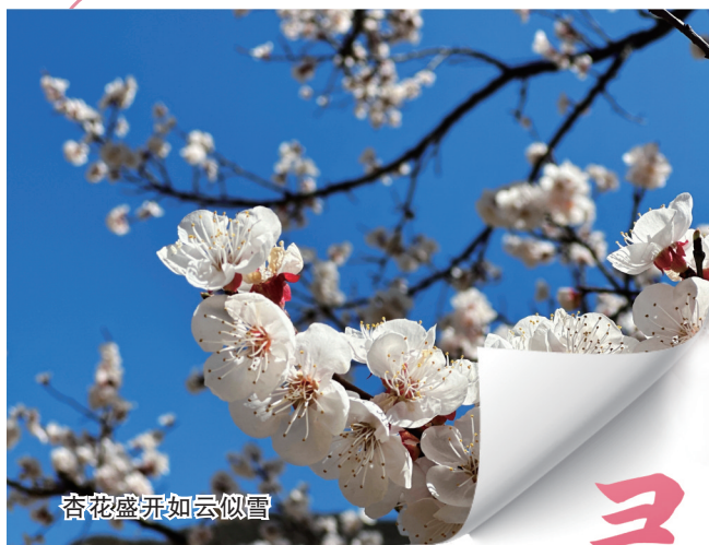
杏花盛开如云似雪