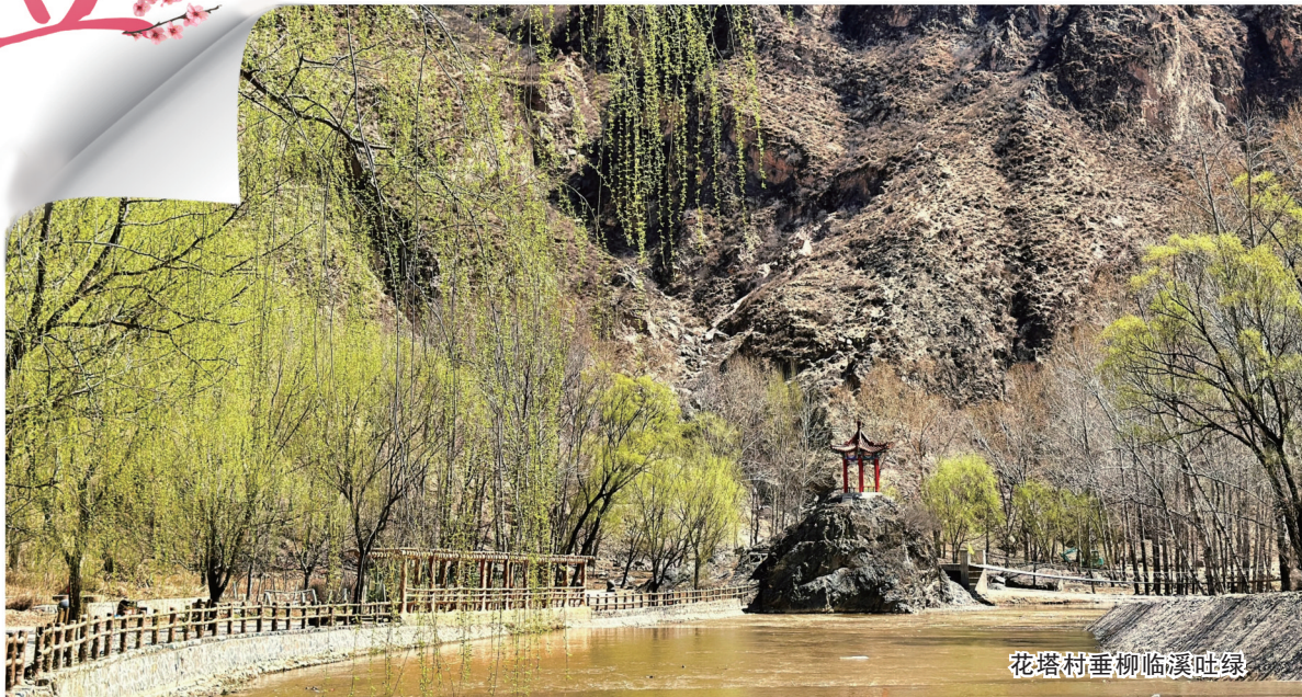
花塔村垂柳临溪吐绿