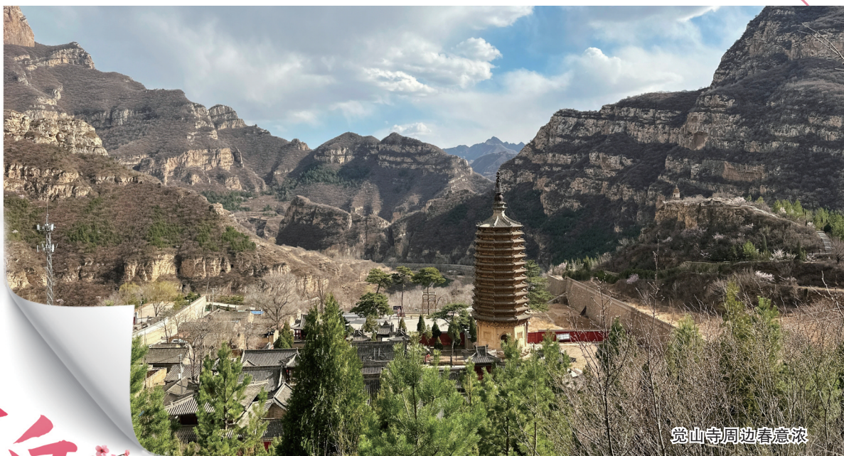
觉山寺周边春意浓