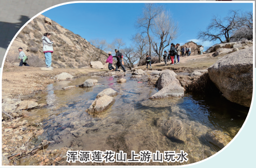
浑源莲花山上游山玩水

清明假期,大同迎来客流高峰,古城内华严寺、九龙壁、法华寺、古城墙、鼓楼东西街、东南区及历史文化街区人头攒动;周边游持续升温,市民和游客纷纷走出家门亲近自然,享受春日惬意时光。