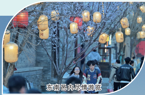
东南区内尽情游览