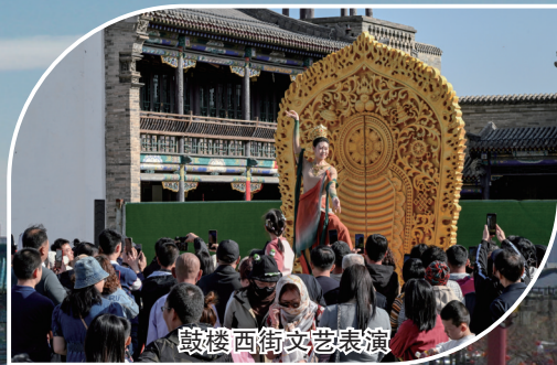
鼓楼西街文艺表演