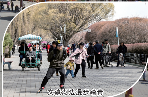
文瀛湖边漫步踏青