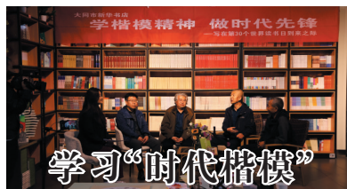
学习“时代楷模” 增强担当意识

参加活动的孩子们头戴哪吒同款丸子头发箍,表演电影中有兴趣的桥段,用童趣语言讲述勇敢与善良;他们还“化身”小哪吒,在书海中寻找与哪吒相关的书籍和故事,分享阅读乐趣。在完成既定的打卡任务后,他们还体验了非遗衍纸手工哪吒画像制作,从而了解衍纸历史,感受非遗魅力。一位家长表示:“通过参加这种兼具趣味性与探索性的活动,能让孩子积极地加入全民阅读行列,在文字阅读中进行思考,同时通过非遗体验,不断加深活动参与者对传统文化的认识与感悟。”