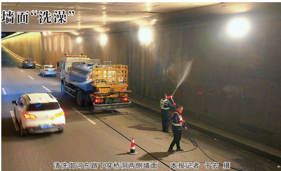
清洗御河东路下穿桥洞两侧墙面

新城环卫公司负责人介绍,经前期排查,御河东路下穿桥洞两侧墙面因长期积垢,严重影响市容与旅游形象。为不影响交通,自4月18日起,该公司每日夜间10时至次日凌晨2时,采用“机械+人工”协同模式,利用高压清洗车冲洗桥洞墙体。