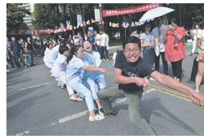
看表情以为真的使劲了，后来才发现是疼的。