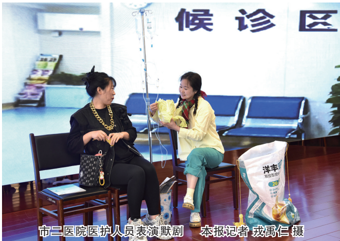
市二医院医护人员表演默剧

本报讯（记者 高燕）一袭素雅的白衣，一顶简约的燕尾帽，你们是生命的守望者——护士。5月12日是国际护士节，为充分发挥先进典型的示范引领作用，激励广大护理人员积极进取、爱岗敬业，连日来，我市各医院举办表彰活动的同时，以丰富多彩的形式庆祝国际护士节，平时忙碌在临床一线的白衣天使也成为舞台的主角。