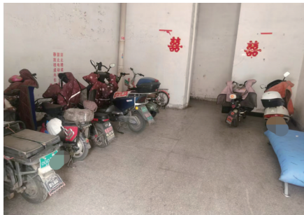
楼道停放的电动车、摩托车

5月8日，记者实地走访，证实居民反映的问题确实存在。小区物管站相关负责人向记者表示，单元门维修申请已提交上级部门，正在等待经费审批，一旦获批立即进行维修。居民反映的其他问题，物管站已了解情况，部分问题正在处理，其余问题也将逐步制定解决方案，努力改善小区管理，提升居住环境质量。