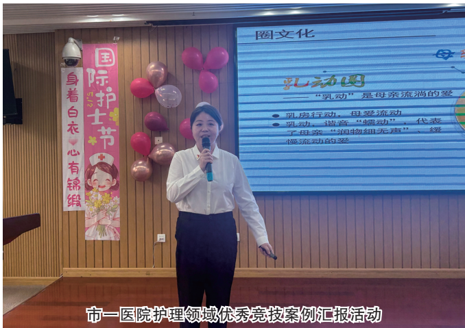
市一医院护理领域优秀竞赛案例汇报活动