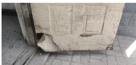
部分单元门破损严重