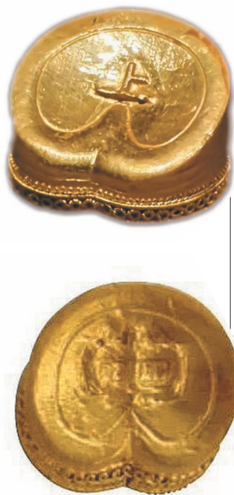
中山怀王墓出土的铭文马蹄金