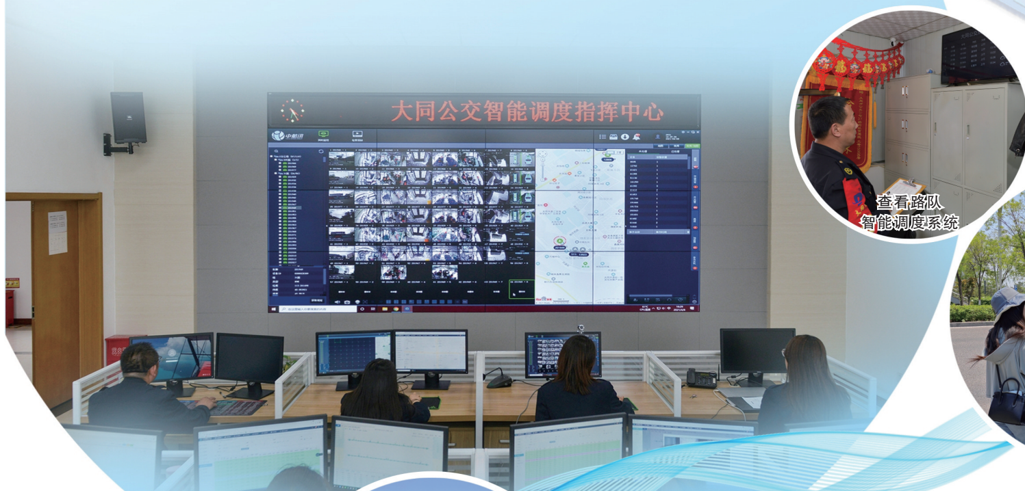
公交智能调度指挥中心

公交线路信息实时显示、公交卡业务线上办理、智慧电子站牌全面覆盖……随着我市大力推动“智慧公交”建设,如今乘坐公交出行更加便捷、高效、绿色,为市民游客带来便利的同时,让乘客出行实现了“心中有数”。