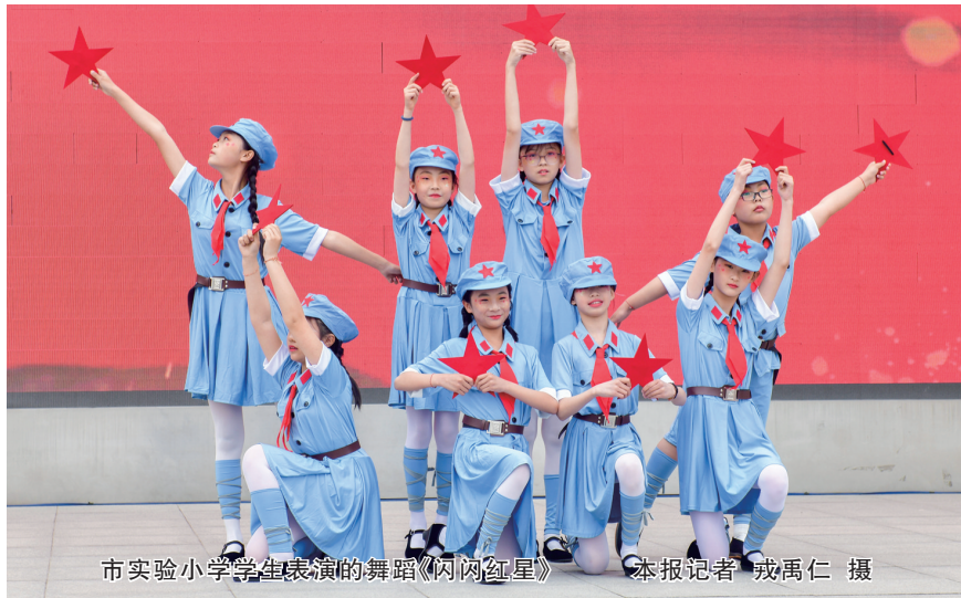
市实验小学学生表演的舞蹈《闪闪红星》

平城区47校举办了“‘玩’转趣味实验，‘点’燃科创梦想”科技嘉年华活动。校园变身科学乐园，学生们热情参与其中，体验了“水火箭”发射、探索“马德堡半球”的大气奥秘、挑战“泡泡套人”等趣味实验项目，在实践中感受科技的魅力与神奇。同时，学校还对荣获“三好学生”“优秀班干部”“优秀少先队员”“新时代好少年”等荣誉称号的学生进行了表彰。