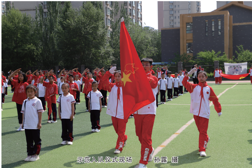
示范入队仪式现场

仪式严格按照中国少年先锋队入队仪式仪程规范执行，出旗、奏唱队歌、宣布组建一年级少先队组织、宣布新队员名单、为新队员授红领巾、新队员宣誓、