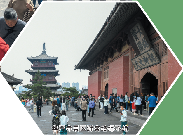
华严寺景区游客络绎不绝