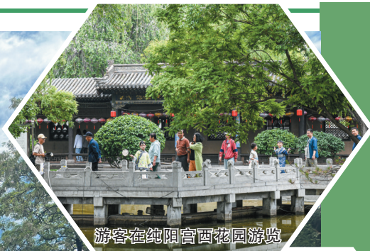
游客在纯阳宫西花园游览