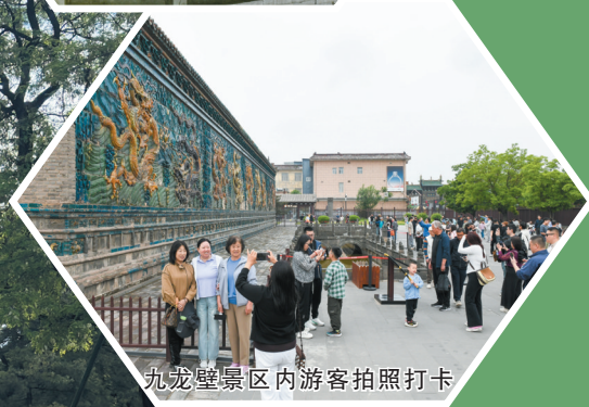
九龙壁景区内游客拍照打卡