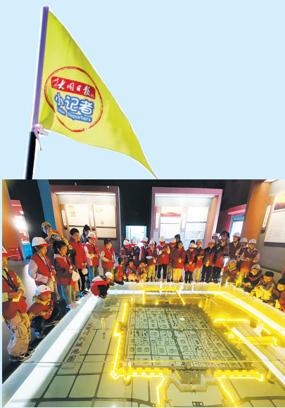
讲解员介绍城墙文化