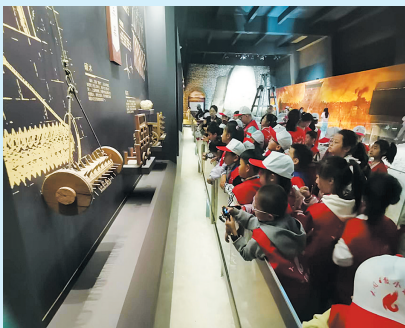
小记者了解古代守城兵器

本报讯（记者 李玉伟）“北魏京华、明清重镇、京师藩屏……”仰望馆内悬挂的星空般璀璨的大同名片，低头对比古城墙的建筑模型，5月24日，60多名大同日报小记者走进大同城墙遗址陈列馆，开启了一场穿越时空的家乡文化探索之旅。