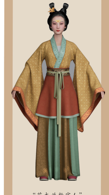
“花木兰数字人”女装形象