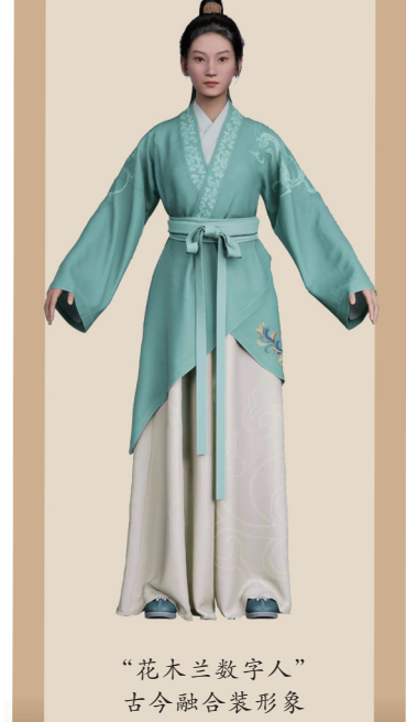
“花木兰数字人”古今融合装形象