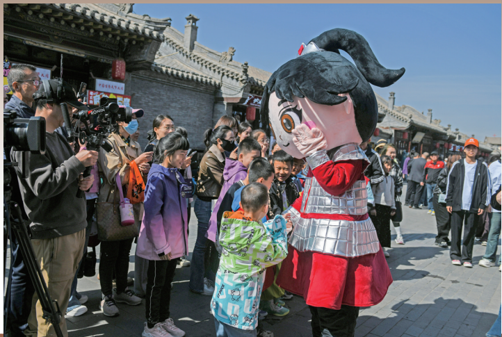
◀“五一”期间,大同市鼓楼西街木兰工作室门前,主题活动吸引了许多游客。