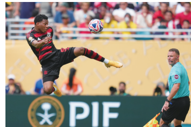
弗拉门戈队球员在比赛中

新华社迈阿密6月29日电 2025世俱杯八分之一决赛29日继续进行,拜仁慕尼黑队以4:2战胜弗拉门戈队,晋级八强。