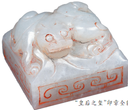
“皇后之玺”印章全貌