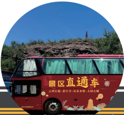
接送旅客的景区直通车