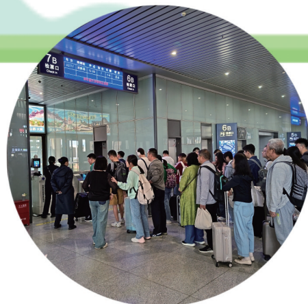
旅客在大同南站验票进站

工作人员特别提醒,旅游旺季期间,景区直通车班次较日常有所增加,发车时刻将动态调整。游客可通过“大同景区直通车”微信小程序购票,从景区出口到乘车点约需5-10分钟,请游客合理安排时间,以免耽误行程。