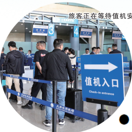
旅客正在等待值机安检

随着云冈国际机场航空口岸的正式开放,大同市民的出境游选择变得越来越丰富。从曼谷的街头美食到乌兰巴托的广袤草原,再到莫斯科的异域风情,这些令人向往的旅游目的地如今都可以从大同直飞抵达。继开通香港、曼谷、乌兰巴托、莫斯科航线后,本月下旬还将迎来大同至首尔航线的开通运营。